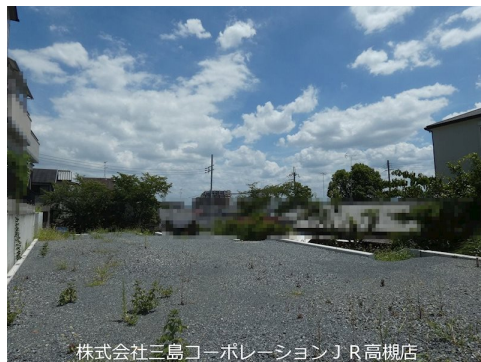
株式会社三島コーポレーション J R高槻店