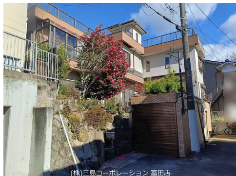
(株)三島コーポレーション 富田店