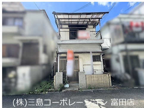
(株)三島コーポレーション 富田店